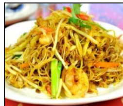
SPICY EGG NOODLE